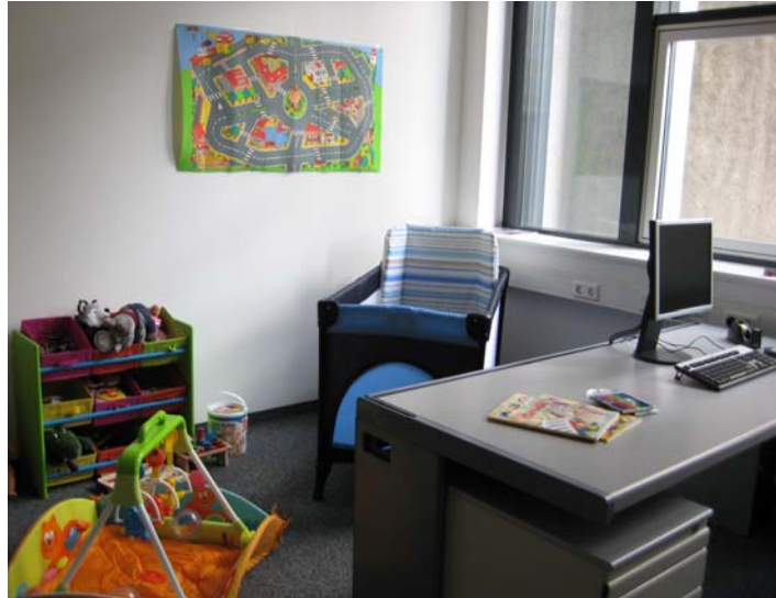
Eltern-Kind-Büro in Köln, Stolberger Str. 76